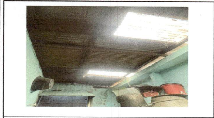
Foto1: Cambio de techado y ampliacion de cocina